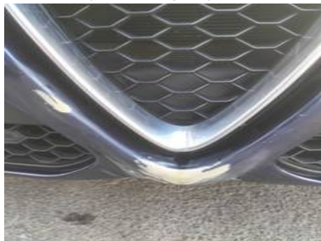
Calandre (Défaut aspect)